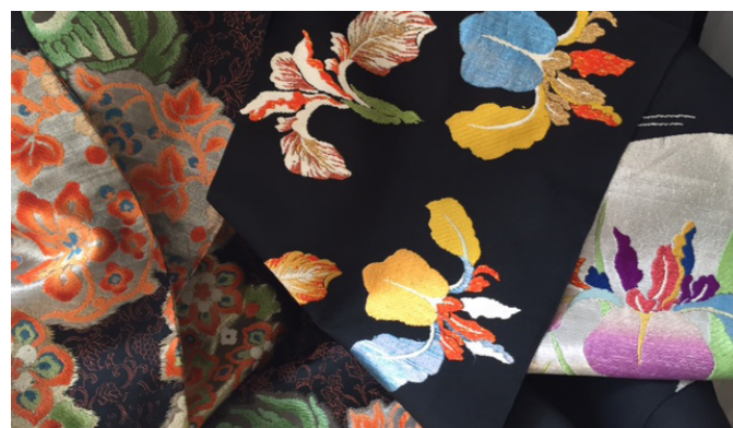
→ Lee Mingwei, Bedtime Stories, 2017. Recherches

Le van-bibliothèque est équipé d'un lit en hauteur assez grand pour accueillir deux personnes d'un côté, et par une sélection de livres pour enfant de l'autre. »