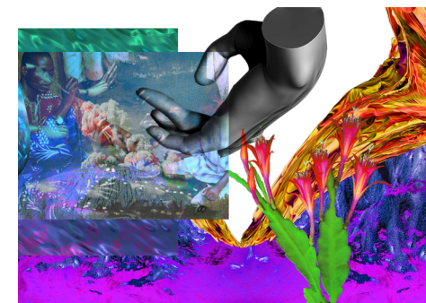
Josèfa Ntjam, Ifa 3.0 Beta , photomontage, 2019

Découvrez les autres rendez-vous sur le site biennaledelyon.com/veduta