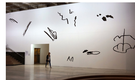
Escif, La Ficción no es delito (Secret Wall) , Palais de Tokyo, Paris, 2018. © Escif

Découvrez les autres rendez-vous sur le site biennaledelyon.com/veduta