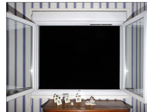
Karim Kal, L'Issue – Rillieux-La-Pape, 2018.

Découvrez les autres rendez-vous sur le site biennaledelyon.com/veduta