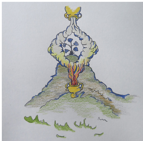
Julieta García Vazquez et Javier Villa, Untitled , 2019 © Julieta García Vazquez et Javier Villa

En collaboration avec Grand Lyon Habitat