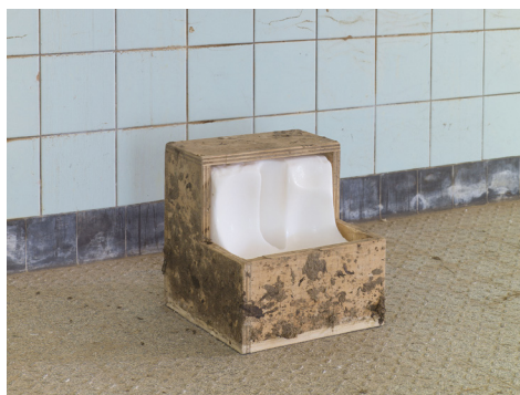
Nicolas Momein, Incomplete Closed Cube, Aliboron l'a digéré , 2011 © Nicolas Momein