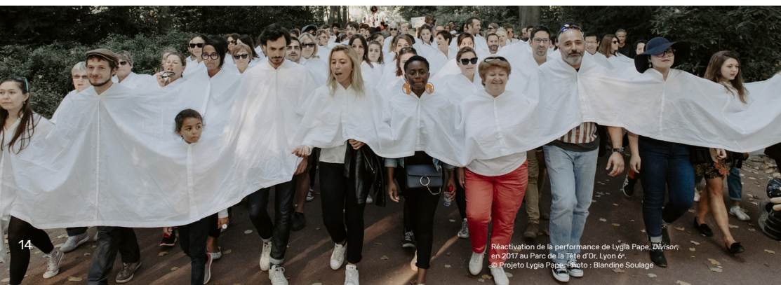
Réactivation de la performance de Lygia Pape, Divisor , en 2017 au Parc de la Tête d'Or, Lyon 6 e .

Sonia Kerfa, professeure en arts visuels du monde hispanique à l'Université Grenoble-Alpes