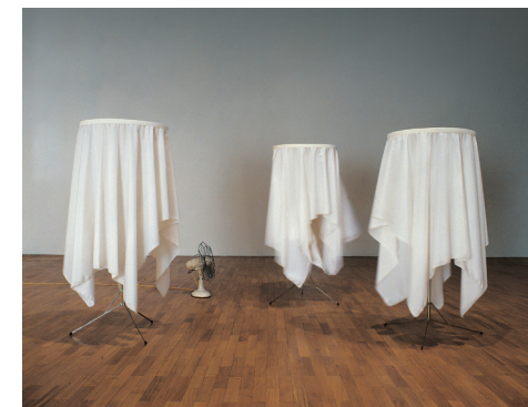
Marinus Boezem, Wind Tables , 1968. Collection maCLYON

Découvrez les autres rendez-vous sur le site biennaledelyon.com/veduta